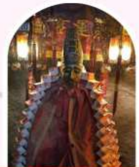
วัดหลินฟ้า โชคโลกและความมั่งคั่ง