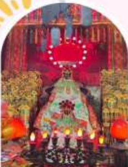
วัดเจ้าแม่กวนอิมอ่องฮ่า บอพรเรื่องเงิน ทรัพย์สิน และความมั่งคั่ง