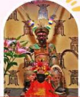
วัดเขangkongเก่าแก่ 400 ปี ไซกง