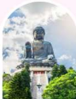
นั่งกระเช้านองปิง นมัสการพระใหญ่ไป่หวลลิน