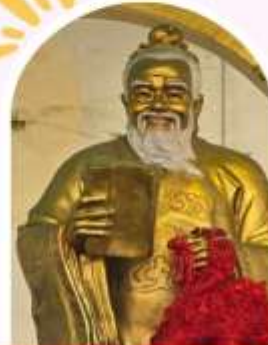
วัดหวังต้าเซียน บอพรสุขภาพ ความรัก