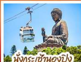
นั่งกระเช้าเองปีง พระใหญ่เกาะศินตา