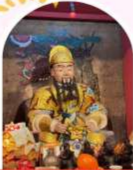
วัดเขangkongเก่าแก่ 600 ปี หยุนหลง

"ไหว้พระ เสริมดวง เพิ่มสิริมงคลแก่ชีวิต"