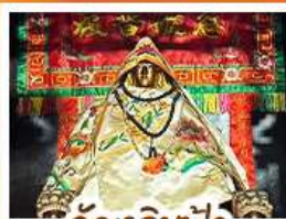
วัดเสลินฟ้า