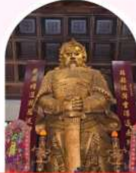
วัดเขangkong ชาถิ่น บอพรโชคโลก การเงิน และธุรกิจ