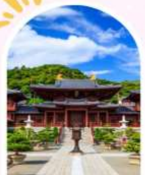
วัดนางชีฉิลลิน สวนหนานเหลียน