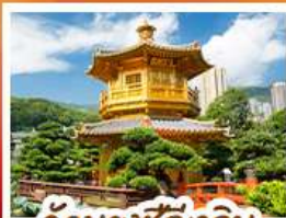
วัดนางชีฉีเสลิน