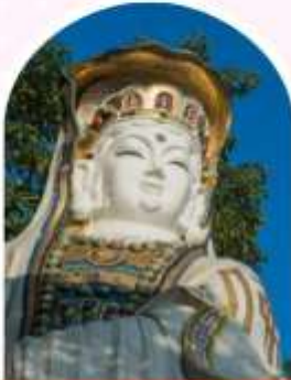
ริพลัสเบย์ รับพลังงานดี เสริมพลังดวงจัญ