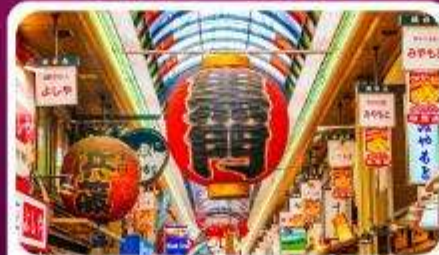
ตลาดปลาคุโรมง