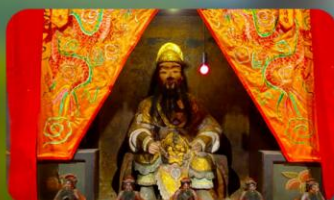
องค์แชกงเก่า 600 ปี