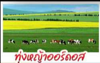
ทุ่งหญ้าเออร์ดอส

ทุ่งหญ้าเออร์ดอส สุสานเจกิสถาน แกรนด์แคนยอนแม่น้ำเหลือง