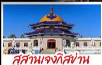
สุสานเจกิสถาน