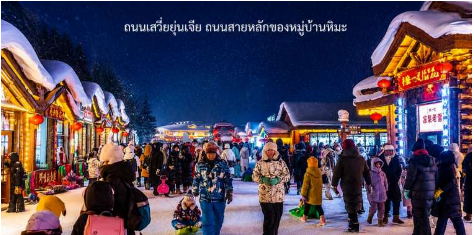
ถนนเสวี่ยยูนเจีย ถนนสายหลักของหมู่บ้านหิมะ

เดินทางเข้าสู่ที่พักในหมู่บ้านหิมะ Xuexiang (GAO LAOWU MINSU) ที่พักสไตล์มาตรฐานท้องถิ่น