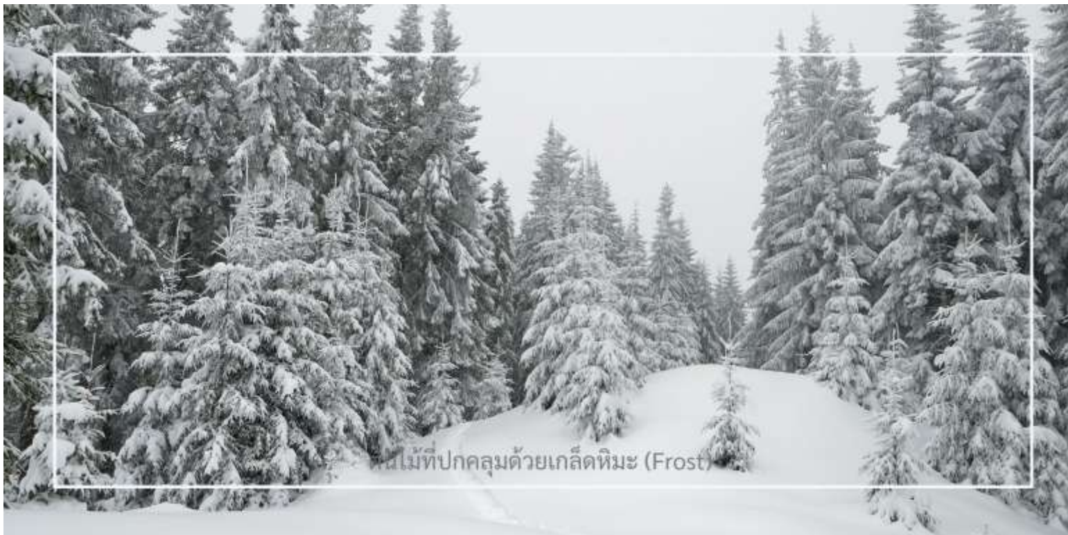
ต้นไม้มักปกคลุมด้วยเกล็ดหิมะ (Frost)

ยาบูลี (Yabuli) เมืองตากอากาศชื่อดังทางตอนเหนือของจีน ตลอดเส้นทาง ท่านจะได้เพลิดเพลินกับทัศนียภาพของฤดูหนาวที่งดงาม ราวกับฉากในนิยาย ท่ามกลางต้นไม้มักปกคลุมด้วยเกล็ดหิมะ (Frost) ระเบียบระยับราวคริสตัล สองข้างทางแต่งแต้มไปด้วยหิมะขาวนวล เป็นบรรยากาศที่หาได้ยากและงดงามจับใจในแบบเฉพาะของดินแดนภาคตะวันออกเฉียงเหนือของจีน