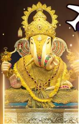
องค์ศักดิ์บูทพิเศษ