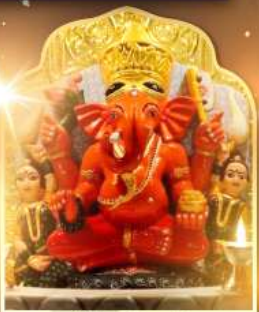
องค์สิทธินายก