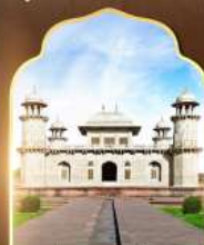
ถ้ำมาฮาลน้อย