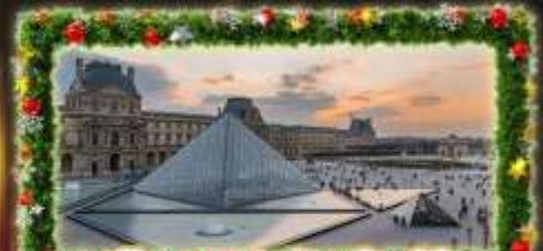
เจ้าชมพีระมิดที่ลูฟร์