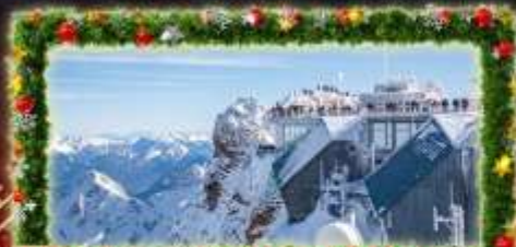
พีชิต Zugspitze Top Of Germany