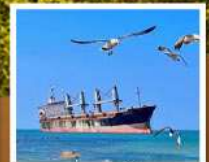
เรือสินค้ากยตึนบลูวิซ