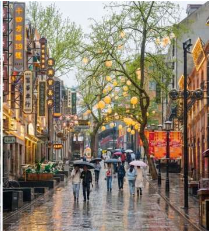
บ่าย นำท่าน เซ็คอินย่านเมืองเก่าเยอรมัน เริ่มต้นที่ ตรอกกว้างซิงหลี จุดเซ็คอินสุดฮิปแห่งซิงเต่าที่ลมหายใจแห่งอดีตยังมีชีวิต ย้อนเวลากลับไปในซิงเต่าเมื่อร้อยกว่าปีก่อน ที่นี่คือย่านเก่าแก่ที่ถูกปลูกให้กลับมามีชีวิตชีวาวี้อีกครั้ง กลายเป็นแหล่งรวมตัวของเหล่าฮิปสเตอร์และนักท่องเที่ยวที่ต้องการสัมผัสเสน่ห์ที่ไม่