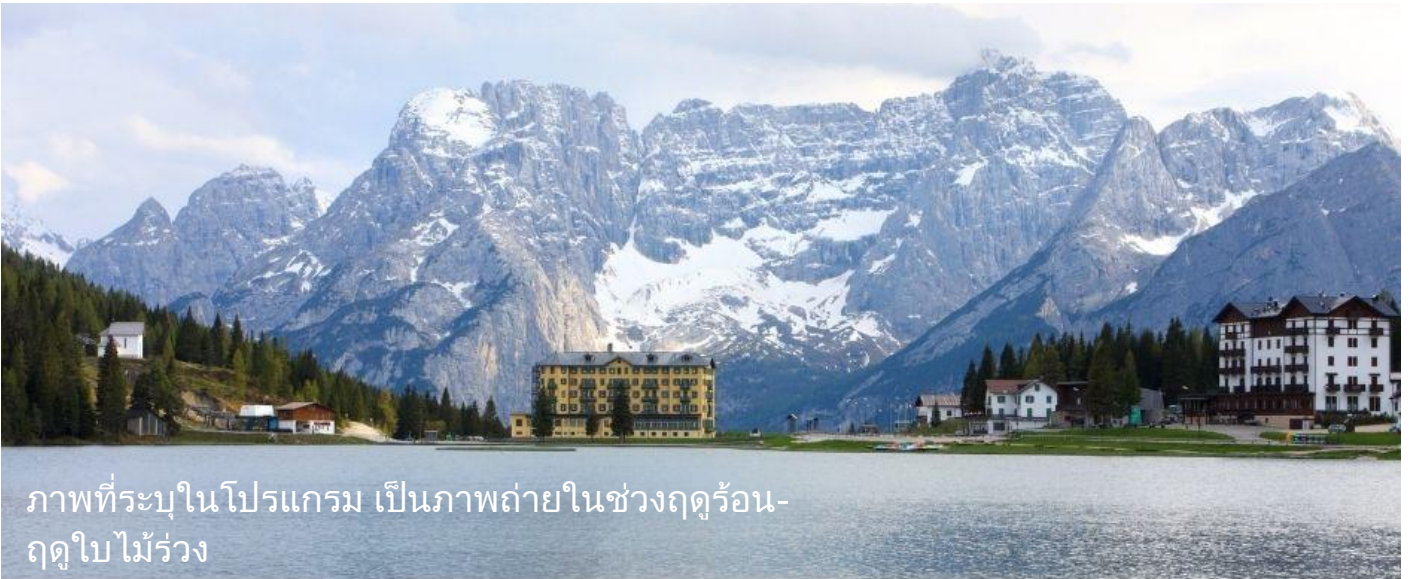
ภาพที่ระบุในโปรแกรม เป็นภาพถ่ายในช่วงฤดูร้อน-ฤดูใบไม้ร่วง

ในประเทศอิตาลี ด้วยบรรยากาศที่สวยงามของทะเลสาบหลายแห่งและเทือกเขาหินปูนที่สวยงามแปลกตาสูงตระหง่าน ใช้เวลาเดินทางประมาณ 2.30 ชั่วโมง จากนั้นนำท่านเดินทางสู่ ทะเลสาบมิซูลิน่า (MISURINA LAKE) ถ่ายรูปกับทะเลสาบที่สวยงาม และเป็นเหมือนกับหนึ่งในแลนด์มาร์คที่นักท่องเที่ยวต้องมาเยือนสักครั้งหนึ่ง เป็นทะเลสาบที่หลบซ่อนตัวในหุบเขา ที่ถือเป็นสถานที่ท่องเที่ยวที่สำคัญอีกแห่งในโดโลไมท์