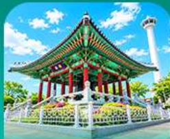
สวนยงกุงซา