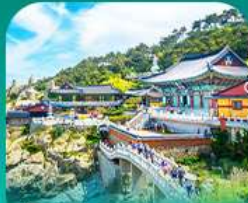
วัดแฮดงงกุงซา

เที่ยวปูซานแบบแกรนด์ แกรนด์ ทั้งสายอาร์ท สายบู และสายช้อปปิ้ง • เช็กอินแมนท่าเรือสุดคูลเลอร์พล ที่ท่าเรือจินนิม (BUSAN BUNEZIA) เต้นเล่นหมู่บ้านคิมซอน ชานโดรีนี่แห่งปูซานสุดน่ารัก พลาดไม่ได้กับการนั่งรถไฟปูนิ๊ก ชมวิวทะเลเมืองปูซาน • เสริมสิริมงคลที่วัดแสดงยงกุงซา วัดกรมทะเลชื่อดัง พร้อมช้อปปิ้งที่ลือเลื่องคัปปะเมียงเฮ่ากั๊ก และตลาดนิมโพดง ก่อนปิดท้ายด้วย ย่านวัยรุ่นสุดฮิต ซอ มยอน ออว็อน พร้อมชมวิวสะพาน ควังอันยามค่ำที่แสนโรแมนติก