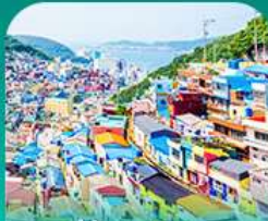
หมู่บ้านคิมซอน