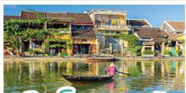
เมืองโบราณเฮอจอัน

! พักบนาน้ำฮิลล์ 1 คืน ! สัมผัสอากาศเย็นตลอดปี สไตล์ฝรั่งเศสสุดคลาสสิก - นั่งกระเช้ายาวที่สุด สู่บานาฮิลล์ สนุกสุดมันส์ไปกับสวนสนุก The Fantasy Park นมัสการเจ้าแม่กวนอิมองค์ใหญ่ที่สุดของเมืองดานัง - ใช้อินเมืองมรดกโลกฮอยอัน - สนุกสนานไปกับกิจกรรม!!นั่งเรือกระดัง หมู่บ้านกัมทาน ใช้อินร้านกาแฟ SON TRA MARINA CAFE - ไม่หลงร้านแซ่บ - อิ่มอร่อยกับบุฟเฟ่ต์นานาชาติ , หม้อไฟซีฟู้ด