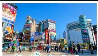
ซ้อป๋ิงซีเหมินตง