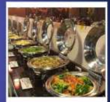
RENYI LAKE HOTEL

หมายเหตุ : **ปัจจุบันโรงแรมได้หวั่นมีนโยบายเพื่อลดโลกร้อน ตั้งแต่ปี 2568 เป็นต้นไป** โรงแรมที่พักงดบริการแจก สบู่ แชมพู ครีมนวด และผลิตภัณฑ์ดูแลผิวส่วนรวม *สิ่งที่ต้องเตรียมของใช้ส่วนตัวไปเอง! ครีมาบน้ำ แชมพู ครีมนวด โลชั่น หมวกอาบน้ำ ทวี แปรงสี ฟัน ยาสีฟัน และของใช้ส่วนตัวอื่นๆ เพื่อสุขอนามัยที่ดีและเป็นมิตรกับโลกลดโลกร้อนรักษโลก...พกของใช้ส่วนตัว สบายใจ ไร้กังวล