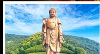
วัดพระใหญ่เฉิงชานต้าฝอ