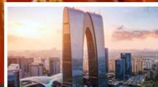
ประตูบูรพาทิศ