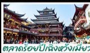
ตลาดร้อยปีเฉิงหวงเหมย