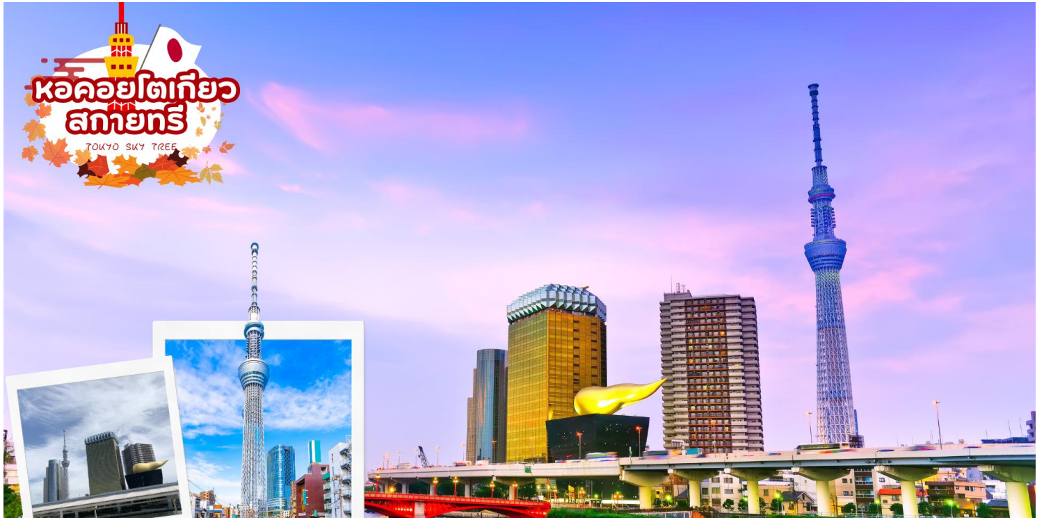
กลางวัน อีรระอาหารกลางวันตามอัธยาศัย