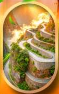
หุบเขาป้ายจ้าง