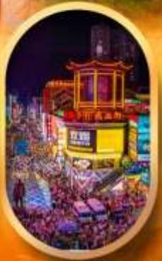
ถนนคนเดินซิงลู่