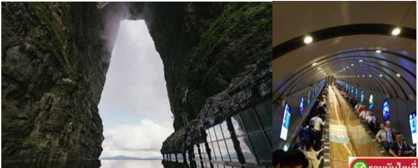
รวมบันไดเลื่อน

จากนั้นนำท่านชมถ้ำเทียนเหมิน หรือ ประตูสวรรค์ (Tianmen Cave) ตั้งอยู่บนภูเขาเทียนเหมินซาน ในเมืองจางเจียเจีย มณฑลหูหนาน ประเทศจีน เป็นช่องเขาหินปูนธรรมชาติที่เกิดจากการพังทลายของหน้าผาในปี ค.ศ. 263 มีความสูง 131.5 เมตร กว้าง 57 เมตร ได้ชื่อว่าเป็น "ซุ้มประตูธรรมชาติที่สูงที่สุดในโลก" และเป็นสถานที่ท่องเที่ยวอันโดดเด่น