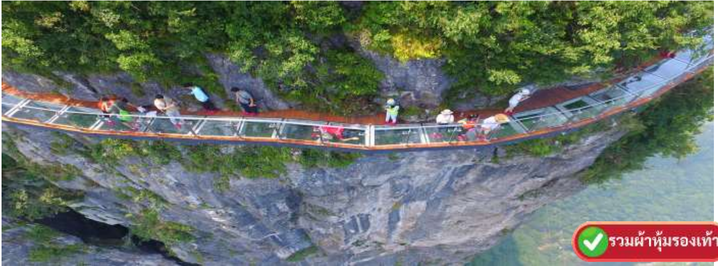
รวมผ้าห่มรองเท้า