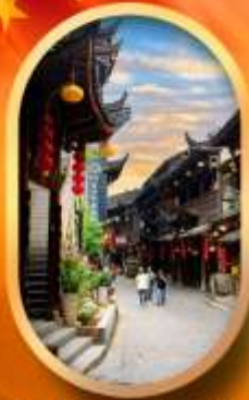
เมืองโบราณฟูหลงเจิน