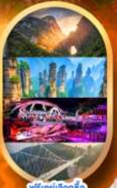
ฟรีคีย์เลือกซื้อ Option เสริม