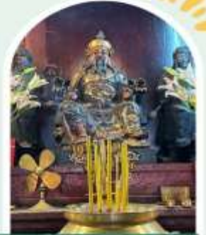
วัดปักไต้ฮ่องกง