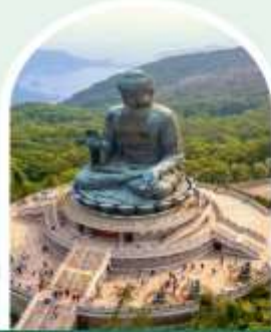
พระใหญ่โปวหลิน