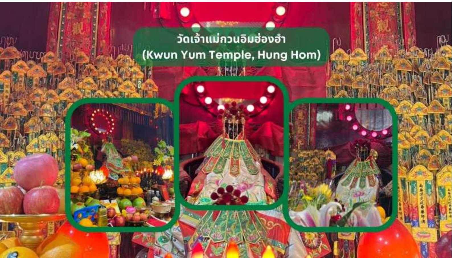
วัดเจ้าแม่กวนอิมฮ่องกง (Kwun Yum Temple, Hung Hom)

นำท่านเดินทางสู่ วัดเจ้าแม่กวนอิมฮ่องกง (Kwun Yum Temple, Hung Hom) เป็นวัดเล็กๆ อันเก่าแก่ ถูกสร้างมาตั้งแต่ปี พ.ศ. 2416 วัดนี้เคยมีปาฏิหาริย์เกิดขึ้น เมื่อช่วงสงครามโลกครั้งที่ 2 มีการปล่อยระเบิดลงบริเวณวัดฮ่องกงหลายต่อหลายครั้ง ซึ่งทำให้มีผู้บาดเจ็บล้มตายเป็นจำนวนมากทว่าชาวบ้านที่เข้าไปหลบภัยในวัดฮ่องกงกลับปลอดภัยไม่ได้รับความบาดเจ็บ รวมถึงตัววัดก็ไม่ได้รับความเสียหายแบบน่าเหลือเชื่อ จึงทำให้ชาวบ้านศรัทธาและเลื่อมใสในวัดแห่งนี้มากยิ่งขึ้น และมีลักษณะสถาปัตยกรรมแบบวัดจีนดั้งเดิม วัดแห่งนี้มีชื่อเสียงโด่งดังในเรื่องของ “พิธียืมเงินเทพเจ้า” เพื่อให้เราร่ำรวยเงินทอง เงินไหลกองทองไหลมา โดยปกติทางวัดจะมีการจัดเทศกาลพิธียืมเงินเทพเจ้าโดยเฉพาะ แต่นอกจากนั้นในวันปกติก็สามารถมาทำพิธีขอได้ตามปกติ วิธีการไหว้และขอพร