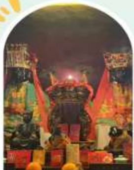
วัดหมั่นโหมว