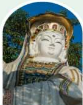
เจ้าแม่กวนอิม ธิพัลลภย์