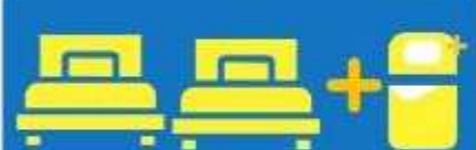
เตียง 3 ท่าน คั่นอนเสริม TRIPLE