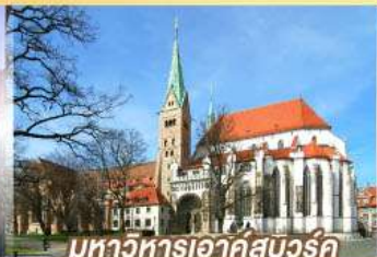
มหาวิหารเอาค์สมวร์ค