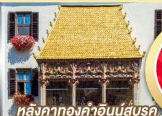
หลังคาทองคำอินน์ส์บรุค