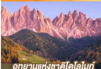
อุทยานแห่งชาติโดโลไมท์

ขึ้นตรงนครอัมสเตอร์ดัม กับเส้นทางสายโรแมนติก พร้อมการแสดงพื้นบ้านสไตล์ที่โรเลียนสุดพิเศษ