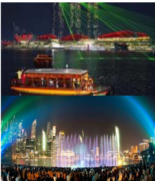
ลานที่นั่งหันหน้าออกทางอ่าว Marina

จากนั้นนำท่านเปิดประสบการณ์กับการเดินทางแสนพิเศษ นั่งเรือแบบคลาสสิกโบราณที่เป็นเอกลักษณ์ของประเทศสิงคโปร์ หรือที่เรียกว่า Bumboat ล่องเรือชมสถานที่ไฮไลท์ของสิงคโปร์ และเก็บภาพสวยๆจากมุมมองแม่น้ำ เช่น เมอร์ไลออน, สะพานเกลียว Helix Bridge, อาคารรูปเรือ มารินาเบย์ แซนด์ เป็นต้น จะใช้เวลารอบละประมาณ 40 นาทีด้วยกัน (รวมค่าบริการ Bumboat)