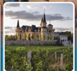
ไร่ไวน์ จุนยี่ เย็นโก