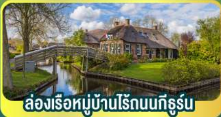
ส่องเรือหมู่บ้านไรน์บนที่จอร์น