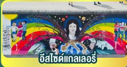
อีสไซด์เทกลเลอร์