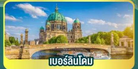
เบอร์ลินโดม