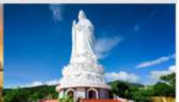
วัดลินฮ้าง

*ทางบริษัทฯ ขอสงวนสิทธิ์ในการสลับโปรแกรมทัวร์ตามความเหมาะสมขึ้นอยู่กับสถานการณ์หน้างาน โดยคำนึงถึงผลประโยชน์ของลูกค้าเป็นสำคัญ