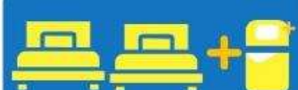
เตียง 3 ท่าน คับนอนเสริม TRIPLE