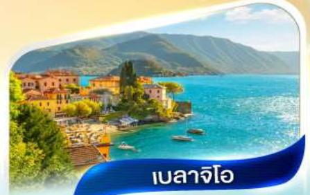
เบลลาจีโอ