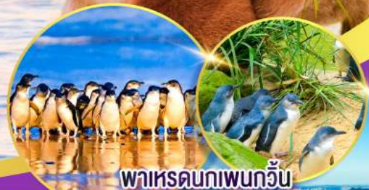
พาหรดนทเพนกวิน

ล่องเรือชมอ่าวซิดนีย์พร้อมรับประทานอาหารกลางวัน และเข้าชมสวนสัตว์ทารองก้า