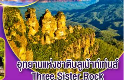
อุทยานแห่งชาติบลูแม้าท์เท็นส์ Three Sister Rock