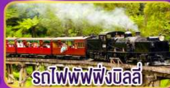
รถไฟพัพฟิงบิลลี่