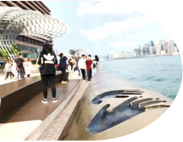
วิคตอเรีย

(เวลาท่องเที่ยวเร็วกว่าประเทศไทย 1 ชั่วโมง) หลังผ่านพิธีการตรวจคนเข้าเมือง ให้คณะท่านออก Exit B