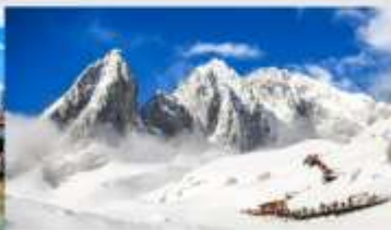
อุทยานหิมะมิงกรหยก