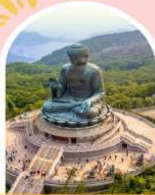
นั่งกระเชานองปิง