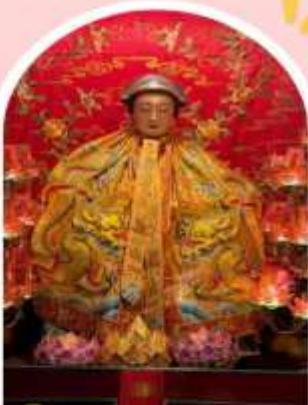
วัดหลังโหมว

ความสำเร็จ ความมั่งคั่ง เงินทองไหลมาเทมา