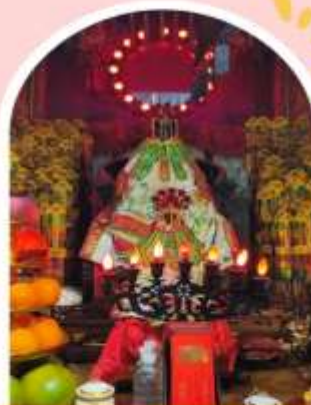
วัดเจ้าแม่กวนอิมอ่องฮำ

ความสำเร็จ ความมั่งคั่ง เงินทองไหลมาเทมา