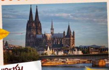
แวะชม มหาวิหารโคโลญ