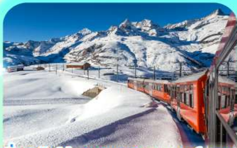
นั่งรถไฟสู่ยอดเขารอนเนอร์เกรต

สวยสะท้านฟ้าที่สวิสฯ สะกิดรักที่โดม พิชิตเขาแมททอร์ฮอร์นและจุงเฟรา