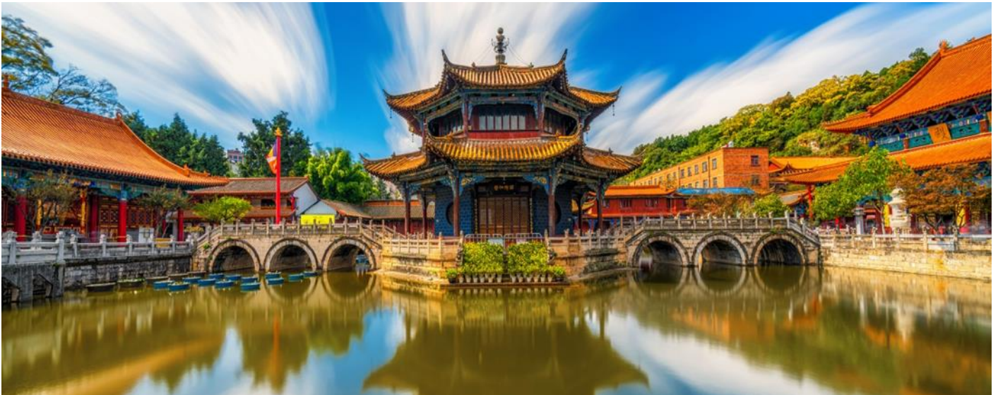
บ่าย นำคณะเข้าชม วัดหยานทง ซึ่งเป็นวัดที่ใหญ่และเก่าแก่ของมณฑลยูนนานตั้งอยู่ที่ถนนหยานทงเจียงเป็นอารามทางพระพุทธศาสนาที่ใหญ่ที่สุดในคุนหมิงอายุเก่าแก่กว่าพันปีภายในวัดตกแต่งร่มรื่นสวยงามกลางลานมีสระน้ำขนาดใหญ่ มีสะพานข้ามไปสู่ศาลาแปดเหลี่ยมกลางสระด้านหลังวัดเป็นอาคารสร้างใหม่ประดิษฐานพระพุทธรูปพระพุทธรชินราช(จำลอง)ซึ่งพลเอกเกรียงศักดิ์ ชมะนันทน์นายกรัฐมนตรีคนที่ 15 ของไทยให้อัญเชิญไปประดิษฐานไว้ ณ ที่วัดหยานทงแห่งนี้