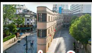
ถนนเก่าคุณหมิง

ภูเขาหิมะ-มังกรหยก+กระเช้าใหญ่ วัดลามะ-ชงจ้านหลิบ - ถนนเก่าคุณหมิง รถไฟชมวิวกุเวาหิมะ-มังกรหยก หุบเขาพระจันทร์สีน้ำเงิน - ช่องแคบเสือกระโจน เมนูพิเศษ ขนจีนข้ามสะพาน สุกี้ยาล่าแซมมอน อาหารกว้างคู้ง