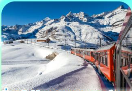
นั่งรถไฟสู่ยอดเขากรอนเนอริเกรต

สวยสะท้านฟ้าที่สวิทซ์ สะกดรักที่โดม พิชิตเขาแมทเทอร์ฮอร์นและจุงเฟรา