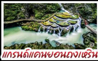
แกรนด์แคนยอนกงเหริน

ชาฟู่านจิ่ง - เมืองโบราณผู่หลงจั้น เมืองโบราณเฟิ่งหวง - เกาะสึมจิวจิว แกรนด์แคนยอนกงเหริน - ไม่ฟ้าร้านซ้อป พักโรงแรม 5 ดาว - รถไฟความเร็วสูง