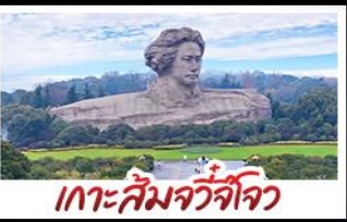
เกาะสึมจิวจิว