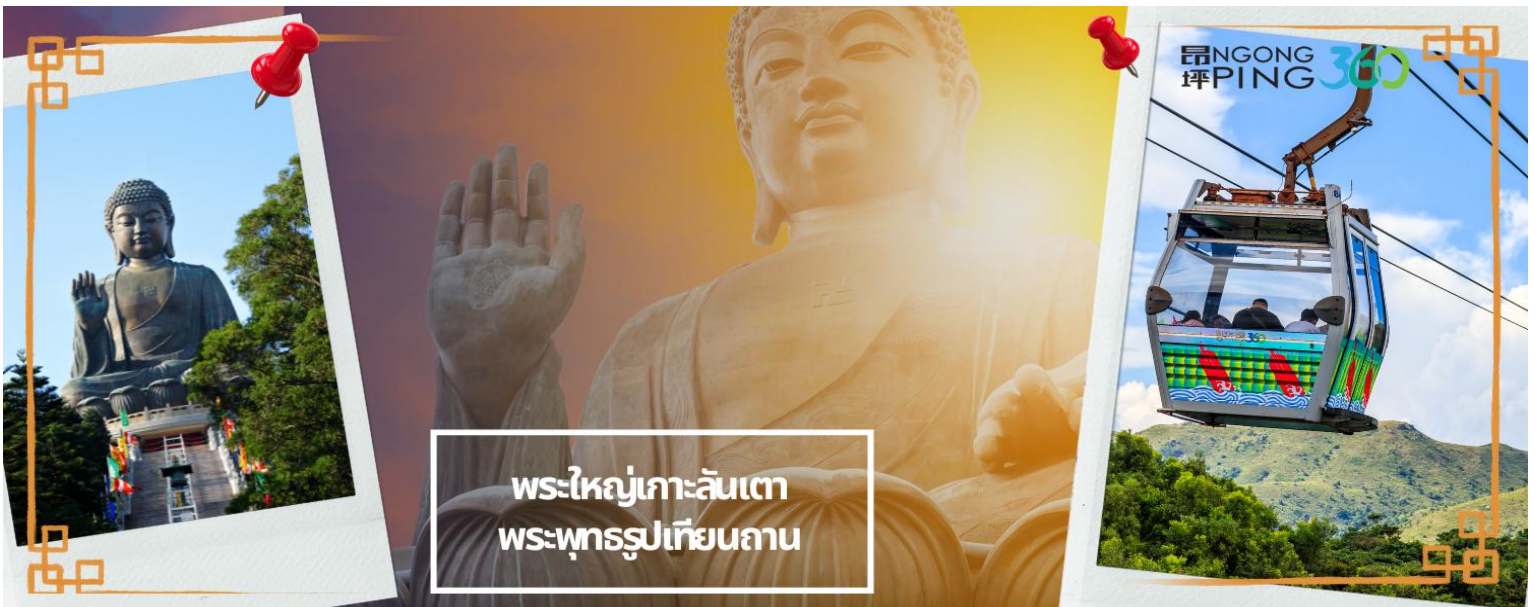
พระใหญ่เกาะลันเตา พระพุทธรูปเทียนถาน

จากนั้นเดินทางสู่เกาะลันเตา เพื่อไปที่สถานีตุงซุง ท่านจะได้สัมผัสกับประสบการณ์ที่น่าตื่นตาตื่นใจจาก กระเช้าลอยฟ้า นงปิง (NGONG PING SKYRAIL 360 **STANDARD CABIN**) ซึ่งถือได้ว่าเป็นแหล่งท่องเที่ยวอันมีเอกลักษณ์ ระดับโลกของฮ่องกง ที่มีระยะทางกว่า 5.7 กิโลเมตร ใช้เวลาประมาณ 25 นาที ท่านจะได้สัมผัสบรรยากาศจากบน กระเช้ามุมสูง เส้นทางกระเช้าเชื่อมจากใจกลางเมืองตุงซุง ถึง หมู่บ้านวัฒนธรรมนงปิง บนเกาะลันเตา ท่านจะได้ชมวิว แบบพาโนรามา 360 องศา ของสนามบินนานาชาติฮ่องกง ทิวทัศน์เหนือท้องทะเลของทะเลจีนใต้ ชมวิวของเนินเขาอัน เขียวขจี น้ำตก ลำธาร และป่าอันเขียวชอุ่มของอุทยานบนเกาะลันเตาเหนือ (**กรณีกระเช้านงปิง 360 มีการปิดซ่อม บำรุง หรือ มีการปิดเนื่องจากสภาพอากาศแปรปรวน ทางบริษัทฯ ขอสงวนสิทธิ์ในการเปลี่ยนเป็นใช้รถโค้ชของทาง อุทยานในการเดินทาง เพื่อนำท่านขึ้นสู่หมู่บ้านวัฒนธรรมนงปิง บนเกาะลันเตาแทน**) จากนั้นนำท่านไปสักการะ พระใหญ่เกาะลันเตา หรือ พระพุทธรูปเทียนถาน (TIAN TAN BUDDHA STATUE) ที่ตั้งตระหง่านอยู่บริเวณริมหน้าผา เป็นพระพุทธรูปทองสัมฤทธิ์กลางแจ้งที่ใหญ่ที่สุดในโลก องค์พระทำขึ้นจากการเชื่อมแผ่นทองสัมฤทธิ์กว่า 200 แผ่น เข้าด้วยกัน น้ำหนักรวม 250 ตัน และสูง 34 เมตร หันพระพักตร์ไปทางด้านทะเลจีนใต้ และมองอย่างสงบลงมายังหุบเขา และโขดหินเบื้องล่างซึ่ง และเชิญท่านอิสระตามอัธยาศัย ลิ้มลองความอร่อยของ อาหารจีนต้นตำรับเมนู อาหารตะวันตก ชั้นเลิศ หรือจะนั่งจิบกาแฟเอ็กซ์เพรสโซอันหอมกรุ่น จากร้านอาหารและร้านค้กาแฟในหมู่บ้านนงปิง หรือบางท่าน