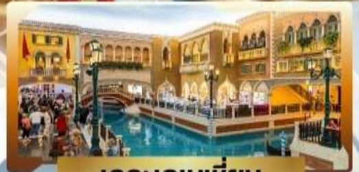
เดอะเวเนเชียน

4 วัน | 3 คืน | 23KG | พักโรงแรม 3 ดาว | นอนมาเก๊า 3 คืน