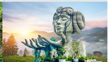
โมอาน่าคาเฟ่

*ทางบริษัทฯ ขอสงวนสิทธิ์ในการสลับโปรแกรมทัวร์ตามความเหมาะสมขึ้นอยู่กับสถานการณ์หน้างาน โดยคำนึงถึงผลประโยชน์ของลูกค้าเป็นสำคัญ