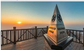
ฟานซิปิน