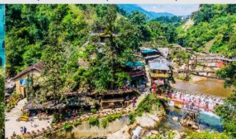
หมู่บ้านก๊ต ก๊ต