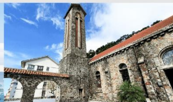
โบสถ์หินตามด้าว