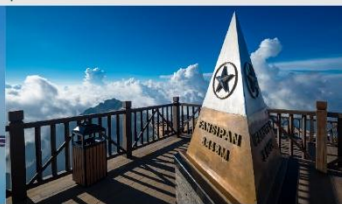
ฟานซิปิน

*ทางบริษัทฯ ขอสงวนสิทธิ์ในการสลับโปรแกรมทัวร์ตามความเหมาะสมขึ้นอยู่กับสถานการณ์หน้างาน โดยคำนึงถึงผลประโยชน์ของลูกค้าเป็นสำคัญ