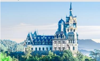
ปราสาทตามด้าว