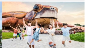
วินเพิร์ล อควาเรียม

*ทางบริษัทฯ ขอสงวนสิทธิ์ในการสลับโปรแกรมทัวร์ตามความเหมาะสมขึ้นอยู่กับสถานการณ์หน้างาน โดยคำนึงถึงผลประโยชน์ของลูกค้าเป็นสำคัญ