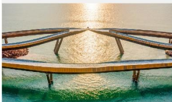
สะพานจวบ