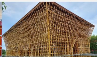
บ้านไม้ไฟ