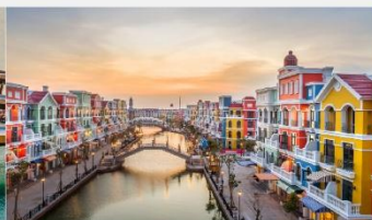
แกรนด์เวิลด์ฟู้ท๊วก