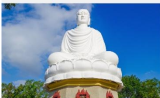
วัดลองเซิน