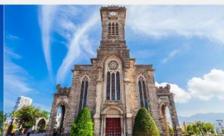
โบสถ์หินญางจาง