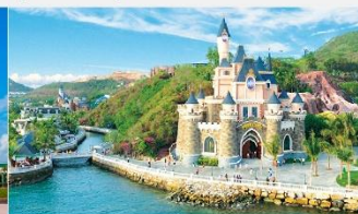
สวนสนุกวันเดอร์ส

*ทางบริษัทฯ ขอสงวนสิทธิ์ในการสลับโปรแกรมทัวร์ตามความเหมาะสมขึ้นอยู่กับสถานการณ์หน้างาน โดยคำนึงถึงผลประโยชน์ของลูกค้าเป็นสำคัญ