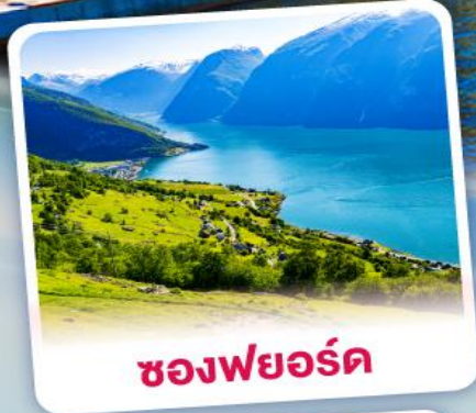
ช่องฟยอร์ด