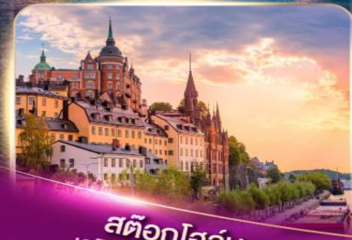
สต็อกโฮล์ม เวนิสแห่งยุโรปเหนือ