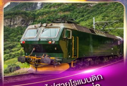
รถไฟสายโรเมนติก ฟลัมส์บาน่า