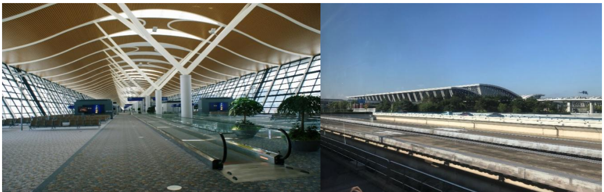
นำท่านเดินทางออกจากสนามบินนานาชาติผู้ตง เชียงใหม่ เพื่อไปถ่ายรูปจุดแลนด์มาร์ค คู่กับ

01.50 น. ออกเดินทางจากสนามบินสุวรรณภูมิ สู่นามบินเชียงใหม่/ ประเทศจีน โดยเที่ยวบิน HO1358 06.55 น. ถึง สนามบินนานาชาติผู้ตง เมืองเชียงใหม่ นำท่าน ผ่านพิธีตรวจคนเข้าเมือง