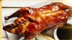
เปิด Four Season