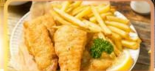
Fish and Chips