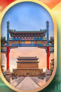
ถนนคนเดินเทียนเหมิน