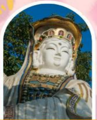
ริพลัสเบย์ รับพลังงานดี เสริมพลังดวงจัญ