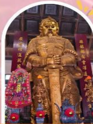
วัดแซกง ขอพรโชคลาภ การเงิน และธุรกิจ