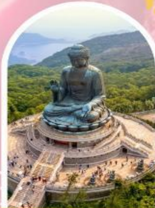
นั่งกระเช้ามองปีง นมัสการพระใหญ่ไป่หวลัน