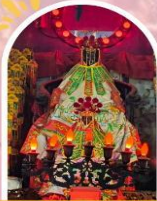
วัดเจ้าแม่กวนอิมอ่องฮำ ขอพรเรื่องเงิน ทรัพย์สิน และความมั่งคั่ง