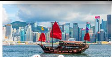
เมืองฮ่องกง

เมืองเก่าซิงเต่า - วิงเมืองฮ่องกง โรงเบียร์ซิงเต่า - ท่าเรือชาวประมงเยียนโต