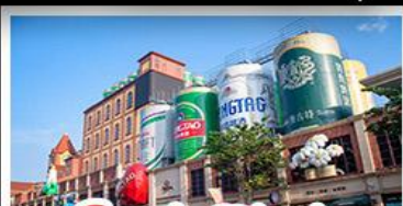
โรงเบียร์ซิงเต่า