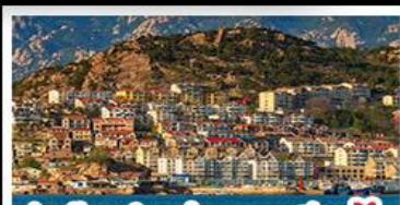
ท่าเรือชาวประมงเยียนโต