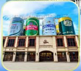
โรงเบียร์ซิงเต่า