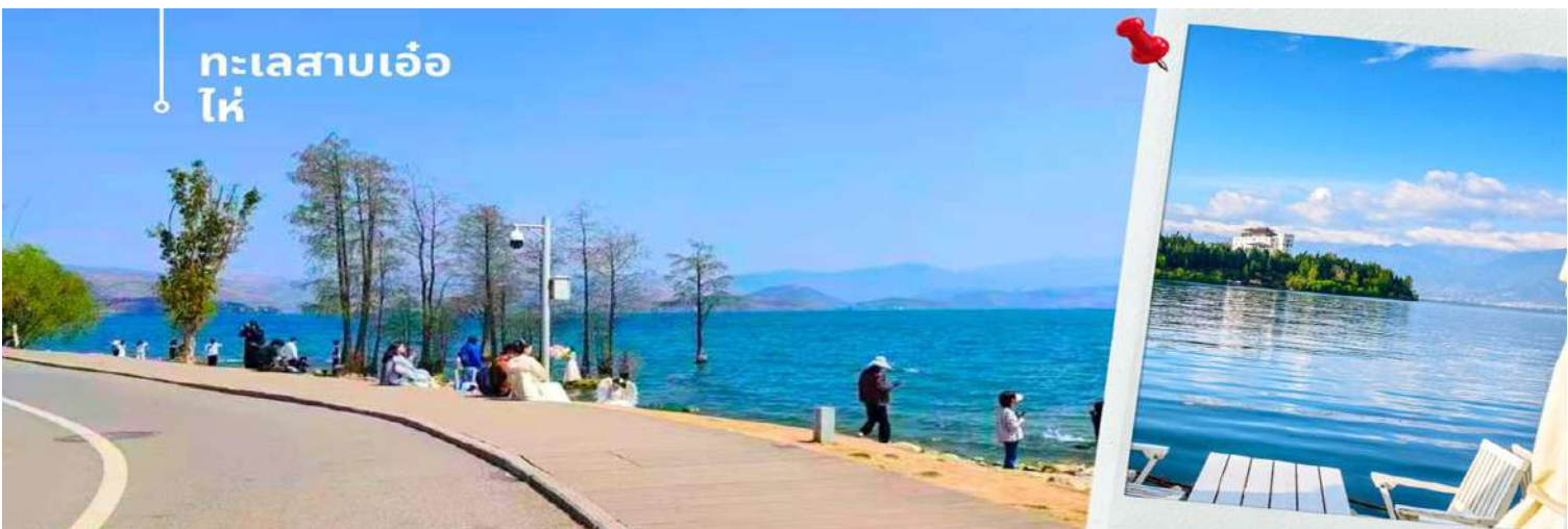
ทะเลสาบเอ๋อไห่

จากแม่น้ำหนุยหลาน ให้เข้าสู่ทะเลสาบเตียนซี น้ำตกแห่งนี้มีความสูง 12.5 เมตร ยาว 400 เมตร ใช้เวลาสร้างเกือบ 3 ปี 🎯 รับประทานอาหารกลางวันที่ภัตตาคาร (2) เมนูพิเศษ!! ขนมหินข้ามสะพาน นำท่านเดินทางสู่ เมืองต้าหลี่ (ใช้เวลาในการเดินทางประมาณ 4 ชั่วโมง) นำท่านเดินทางแวะชม ทะเลสาบเอ๋อไห่ ทะเลสาบเอ๋อไห่มีพื้นที่ตั้งอยู่บนที่ราบสูงในเมือง ต้าหลี่ มีความยาวจากทิศเหนือจรดทิศใต้ราว 20 กิโลเมตร และความกว้างประมาณ 9 กิโลเมตร เป็นทะเลสาบที่ใหญ่เป็นอันดับสองของประเทศจีน ทะเลสาบแห่งนี้มีความสำคัญอย่างมากกับชาวเมืองมาตั้งแต่อดีต เป็นทะเลสาบที่หล่อเลี้ยงชาวบ้านชาวเมือง แต่ในปัจจุบันถึงแม้ว่าความสำคัญดังเช่นในอดีต