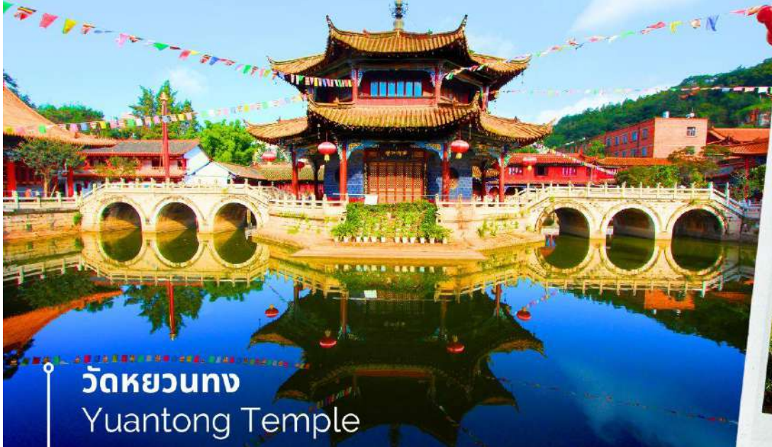
วัดหยวนทอง Yuantong Temple

นำท่านชม วัดหยวนทอง (Yuantong Temple) วัดแห่งนี้เป็นวัดที่ใหญ่และเก่าแก่ที่สุดในเมืองคุนหมิง สร้างมาตั้งแต่สมัยราชวงศ์ถัง มีอายุยาวนานประมาณ 1,200 กว่าปี การสร้างวัดแห่งนี้จะแปลกตากว่าวัดอื่นในจีน เพราะปกติแล้วการสร้างวัดของจีนส่วนมากจะต้องสร้างอยู่บนภูเขา แต่วัดหยวนทองสร้างวัดต่ำกว่าภูเขา โดยวิหารจะอยู่ต่ำที่สุดเนื่องจากวัดแห่งนี้ไม่ได้สร้างขึ้นเพื่อเป็นวัดโดยตรง แต่เคยเป็นศาลเจ้าแม่กวนอิมมาก่อน