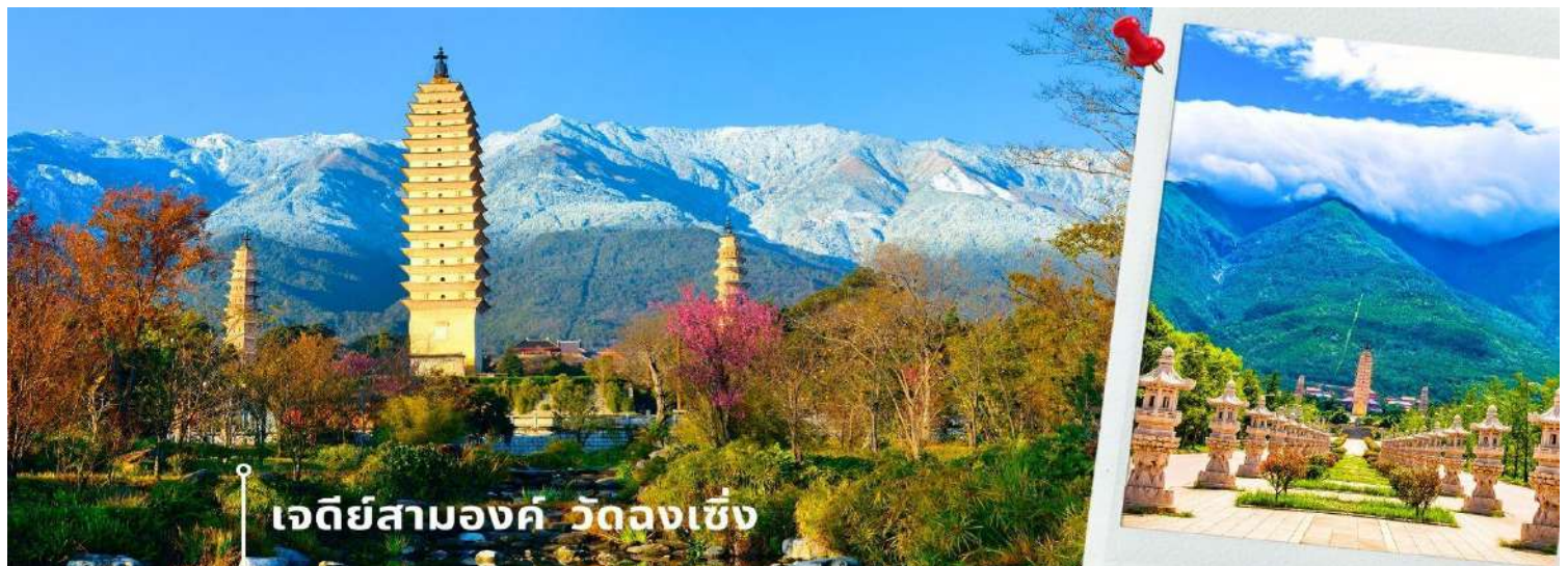
เจดีย์สามองค์ วัดจงเซิ่ง

จากนั้นผ่านชม เจดีย์สามองค์ สัญลักษณ์ของเมืองต้าหลี่ ตั้งอยู่ภายใน วัดจงเซิ่ง (Chongsheng Temple) วัดเก่าแก่ที่สร้างขึ้นเมื่อศตวรรษที่ 9 นับว่าเป็นหนึ่งในเจดีย์ที่สูงที่สุดในประเทศจีน อีกทั้งยังมีความศักดิ์สิทธิ์เป็นอย่างมาก ว่ากันว่าเป็นหนึ่งในสิ่งก่อสร้างเพียงไม่กี่แห่งที่ไม่ถูกทำลายจากเหตุการณ์แผ่นดินไหวในเมืองต้าหลี่เมื่อปี ค.ศ. 1925 จึง