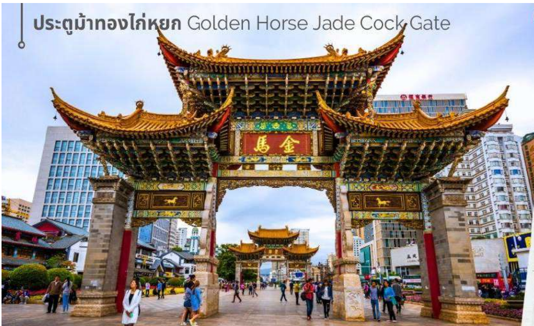
ประตูม้าทองไก่อ่หยก Golden Horse Jade Cock Gate

ชม ซุ้มประตูม้าทอง และ ซุ้มประตูไก่อ่หยก ซึ่งภาษาจีนเรียกว่าจินหม่า และปี้จี้ จิงเอาค่าย่อ จินปี้ มาชานานนามถนนแห่งนี้ ซุ้มม้าทองและไก่อ่หยก มีอายุร่วม 400 ปี สร้างขึ้นในสมัยราชวงศ์หมิง ในถนนย่านการค้าแห่งนี้ เป็นแหล่งเสื้อผ้าแบรนด์เนมทั้งของจีนและต่างประเทศ รวมทั้งเครื่องประดับ อัญมณี ร้านเครื่องดื่ม และร้านขายของที่ระลึกมากมาย