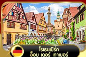
โรเธนบูร์ก อ็อบ เดอร์ เทาเมออร์