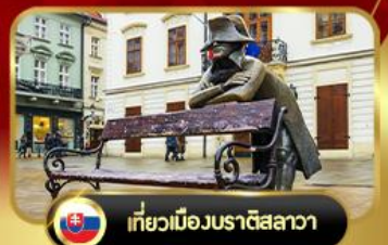
เที่ยวเมืองบราติสลาวา

คาร์โลวี วารี • เซสกี คุรมลอฟ • ซ็อบป์จาเมืองเวียนา • หมู่บ้านริมทะเลสาบ อัลลส์ตัทท์ • ซาลซ์บูร์ก • มิวนิก • เที่ยวย่านเมืองนูเรมเบิร์ก