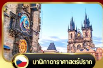
นาฬิกาดาราศาสตร์ปราก