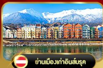
ย่านเมืองเก่าอินส์บรุค