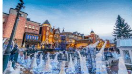
SHIROI KOIBITO PARK