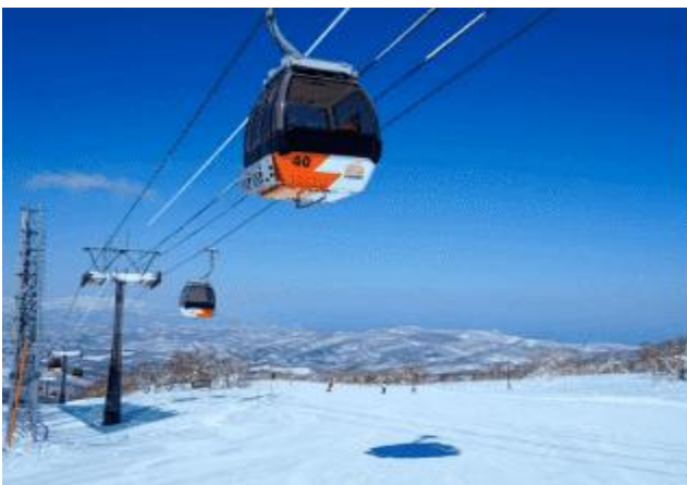
KIRORO SKI RESORT

นำท่านเดินทางสู่ KIRORO SKI RESORT อิสระให้ท่านเล่นกิจกรรม ณ ลานสกี KIRORO SKI RESORT ตามอัธยาศัย (**ไม่รวมค่าเช่า ชุดกันหนาว และอุปกรณ์เครื่องเล่น) ที่นี้มีกิจกรรมทางหิมะให้ท่านเลือกเล่นมากมายไม่ว่าจะเป็น Sled ที่ไหลลงจากเนินสูง ลาน Snow Park ให้เด็ก ๆ เล่นปั้นหิมะ ปาหิมะ ตลอดจนการนั่ง Snow Raft เรือล่องแก่ง Banana Boat ที่ลากด้วยสโนว์โมบิล ขับรถเลื่อนบนหิมะด้วย Mini Snowmobile อาจจะมันส์ขึ้นไปอีกต้องไปซื้รถ ATV Snow Buggy วิ่งไปบนหิมะหนา ๆ นอกจากนี้ยังมีบริการให้ขับรถสองล้อ Snow Segway และปั่นจักรยานท่าหิมะอีกด้วย หรือจะไปที่ สถานี Gondola/Chair Lift (ไม่รวมค่ากระเช้า) ที่อยู่ด้านข้างโรงแรมเพื่อไปยังยอดเขาด้านบน เพื่อไป สั้ระฆังแห่งความรัก Nisa Bell หรือ Lover's Bell ระฆังชื่อดังของยอดเขา Asari หมายเหตุ การเปิดให้บริการของ gondol่าขึ้นอยู่กับกำหนดการเปิดปิดของลานสกีและสภาพอากาศ ณ วันเดินทาง