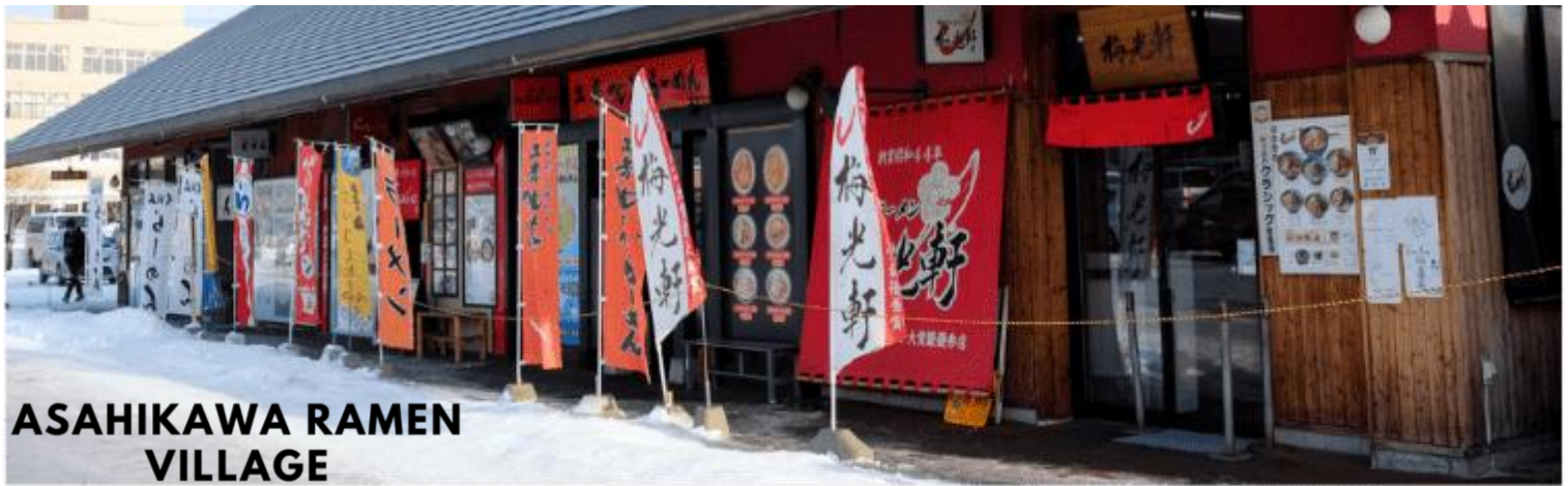
ASAHIKAWA RAMEN VILLAGE

จากนั้นนำท่านสู่ หมู่บ้านราเมนอาซาฮิดาว่า (Asahikawa Ramen Village) แหล่งรวมราเมนเจ้าดังของเมืองอาซาฮิดาว่า ที่คัดสรรร้านยอดเยี่ยมไว้ถึง 8 ร้านในที่เดียว เพลิดเพลินกับการลิ้มลองราเมนสูตรต้นตำรับฮอกไกโด สไตส์ชุปโซยุที่ขึ้นชื่อเรื่องความหอมกลมกล่อม พร้อมเลือกชิมแต่ละร้านได้ตามใจ อีกทั้งยังมีโซนขายของที่ระลึกและพิพิธภัณฑสถานเล็ก ๆ ให้ได้เรียนรู้ประวัติราเมนอีกด้วย