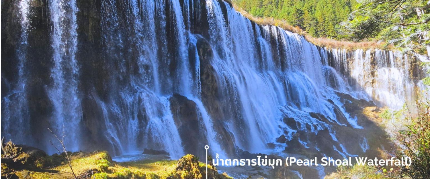
น้ำตกธารไข่มุก (Pearl Shoal Waterfall)

ยามมีแสงแดดส่องตกลงกระทบผิวน้ำจะส่องประกายราวกับเส้นไข่มุกเหมือนชื่อน้ำตก บางครั้งอาจได้เห็นสายรุ้งจากแสงแดดที่สะท้อนกับละอองน้ำอีกด้วย หากได้มาในช่วงฤดูหนาว ก็จะได้เห็นหิมะเกาะตามต้นไม้ โขดหิน และถ้าอากาศหนาวมากๆ น้ำที่น้ำตกก็จะกลายเป็นน้ำแข็ง กลายเป็นประติมากรรมจากธรรมชาติที่สวยงาม