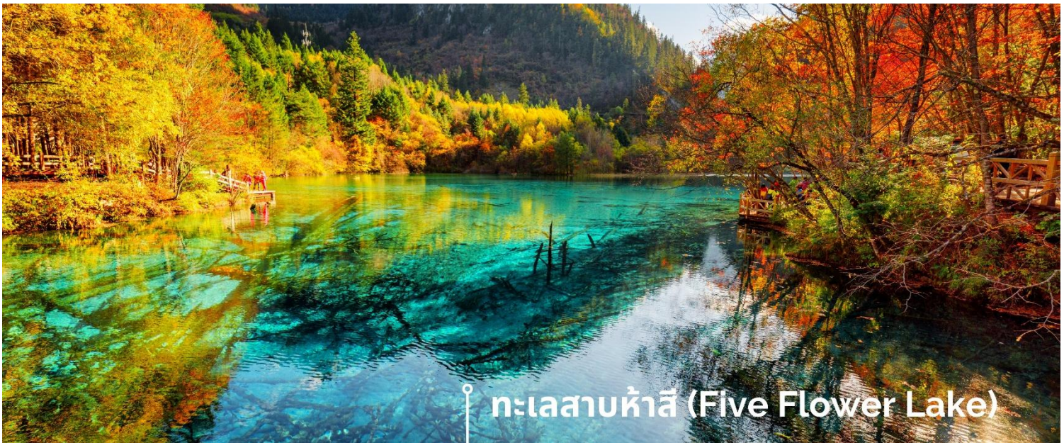
ทะเลสาบห้าสี (Five Flower Lake)

หนึ่งในจุดที่สวยงามและนักท่องเที่ยวแห่มาเยี่ยมชมเยอะที่สุด ตั้งอยู่ที่ความสูงเหนือระดับน้ำทะเลประมาณ 2,472 เมตร น้ำลึกประมาณ 5 เมตร น้ำใสจนเห็นพื้นด้านล่างของทะเลสาบ สีของผิวน้ำสวยงามแปลกตา โดยเฉพาะเมื่อยามแสงอาทิตย์สาดส่องกระทบผิวน้ำ สีของน้ำในทะเลสาบจะสะท้อนเป็นสีส้มถึง 5 เฉดสี สวยงามสะกดตา ซึ่งสาเหตุที่ทำให้เกิดสีส้มต่างๆ นี้มาจากการสะสมของแร่ธาตุ และพีชน้ำชนิดต่างๆ โดยจะมีสีส้มแตกต่างกันไปตามฤดูกาลและช่วงเวลา ยิ่งถ้ามาในช่วงฤดูหนาว ต้นไม้ริมทะเลสาบจะเต็มไปด้วยหิมะสีขาวตัดกับสีของทะเลสาบ ดูสวยงามแปลกตา