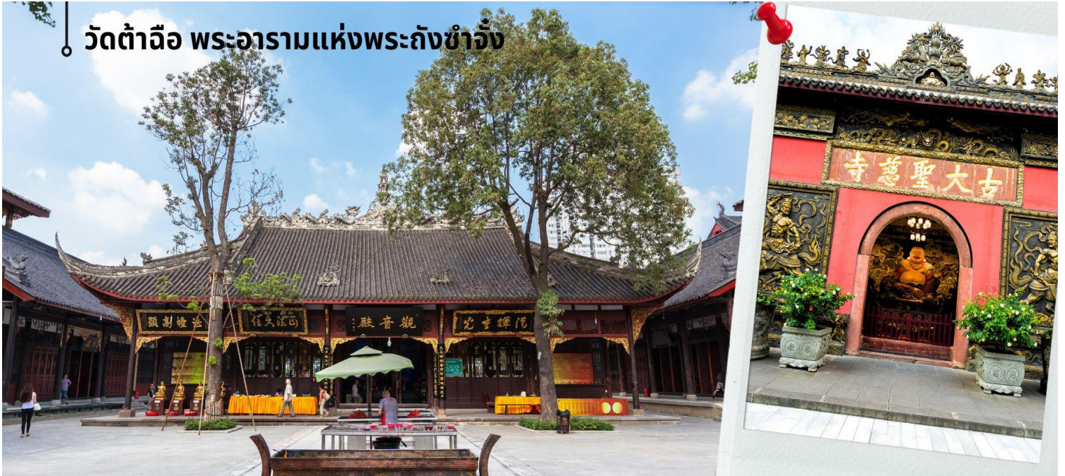
วัดต้าฉือ พระอารามแห่งพระถังซำจั๋ง

นำท่านชม วัดต้าฉือ พระอารามแห่งพระถังซำจั๋ง ไฉกกลางนครเฉิงตู พระถังซำจั๋ง ได้รับการสรรเสริญว่าเป็นผู้มีความเพียร และมีชื่อเสียงมายาวนานกว่า 1,400 ปี และยังได้รับการยกย่องว่าเป็น พระไตรปิฎกแห่งราชวงศ์ถัง พุทธประวัติของพระถังซำจั๋งถูกจารึกในสถานที่ต่างๆ มากมาย รวมไปถึงได้ถูกกล่าวถึงในจดหมายเหตุหลายเล่ม ตามเส้นทางการเดินทางแห่งความเพียรของท่าน รวมทั้งมีพระอัฐิของท่าน ประดิษฐานอยู่ในพระอารามของนครนานจิง และที่ทะเลสาบสุรียันจันทราเป็นเกาะได้หวนอีกด้วย