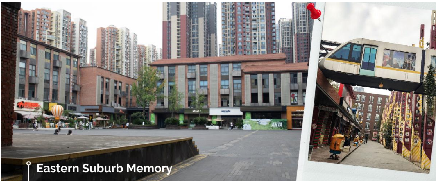
Eastern Suburb Memory

จากนั้นนำท่านเดินทางไปยัง Eastern Suburb Memory หรือ “ความทรงจำของเขตตะวันออก” เป็นหนึ่งในสถานที่ท่องเที่ยวที่โดดเด่นในเฉิงตู ซึ่งได้รับการพัฒนาใหม่จากโรงงานอุตสาหกรรมเก่าให้กลายเป็นศูนย์กลางแห่งการสร้างสรรค์และศิลปะ ที่นี่รวบรวมความเป็นมาทางประวัติศาสตร์และศิลปะสมัยใหม่เอาไว้ด้วยกันอย่างลงตัว จนกลายเป็นพื้นที่ที่เต็มไปด้วยบรรยากาศร่วมสมัยและเสน่ห์ของวัฒนธรรมที่ผสมผสานกันระหว่างอดีตและปัจจุบัน สิ่งที่น่าสนใจภายใน Eastern Suburb Memory คือ ศิลปะร่วมสมัยและนิทรรศการ ,โรงละครกลางแจ้งและคอนเสิร์ต,ร้านกาแฟและร้านอาหารที่มีสไตล์ ,การช้อปปิ้งในร้านค้าสินค้าศิลปะและของที่ระลึก