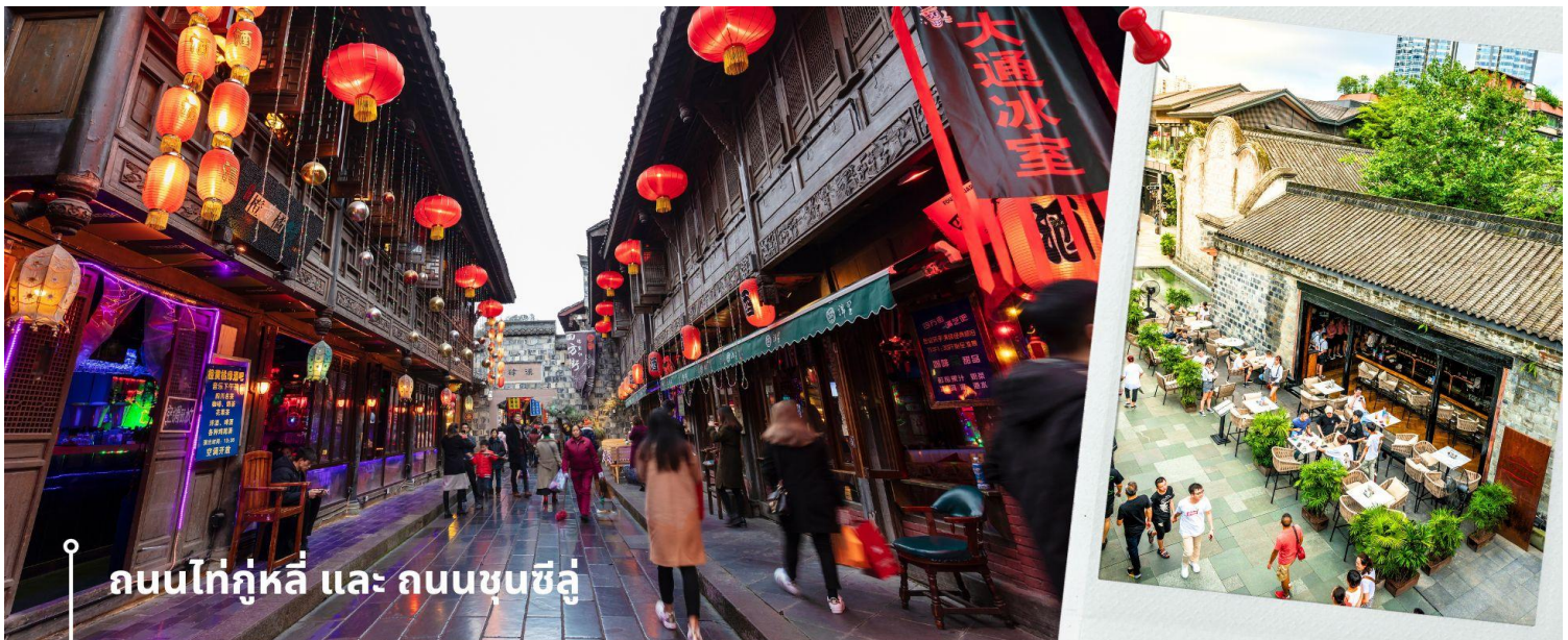
ถนนไท่กุ่หลี่ และ ถนนชุนซีลู่

จากนั้นให้ท่านให้อิสระกับการเลือกซื้อสินค้าของฝากที่ ถนนไท่กุ่หลี่ และ ถนนชุนซีลู่ ในย่านนี้เป็นถนนโบราณ ในอดีตเคยโรงงานผลิตผ้าไหมใหญ่ที่สุดในจีน ปัจจุบันได้เปลี่ยนเป็นถนนช้อปปิ้งแหล่งสวรรค์ของนักท่องเที่ยว เป็นถนนคนเดิน มีห้างสรรพสินค้าชื่อดัง มีร้านค้ามากกว่า 700 ร้านค้าที่เต็มไปด้วยสินค้าต่าง ๆ ทั้งร้านค้าแฟชั่น ร้านอาหารและโรงแรมนานาชาติมากมายซึ่งเป็นที่ที่นักท่องเที่ยวมีการเชื่อมต่อทางวัฒนธรรมท้องถิ่นที่เป็นแหล่งช้อปปิ้งและเป็นแหล่งร้านอาหารที่อร่อยต่าง ๆ มากมาย ซึ่งเป็นสถานที่ที่เที่ยวของเฉิงตูที่ทำให้เพลิดเพลินกับสินค้าแบรนด์เนมและแบรนด์จีน เพื่อให้ให้นักท่องเที่ยวได้เลือกซื้อตามอิสระ แะร้าน POP MART